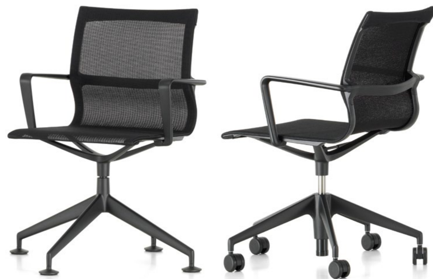
Physix Conference & Physix Studio