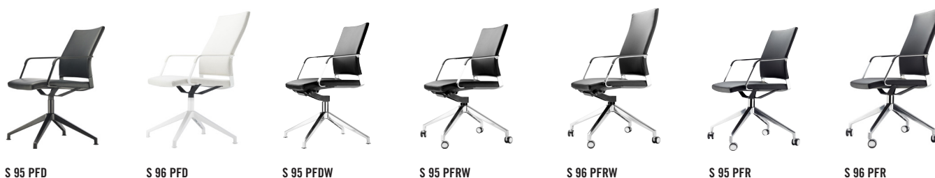
S 95 PFD S 96 PFD S 95 PFDW S 95 PFRW S 96 PFRW S 95 PFR S 96 PFR