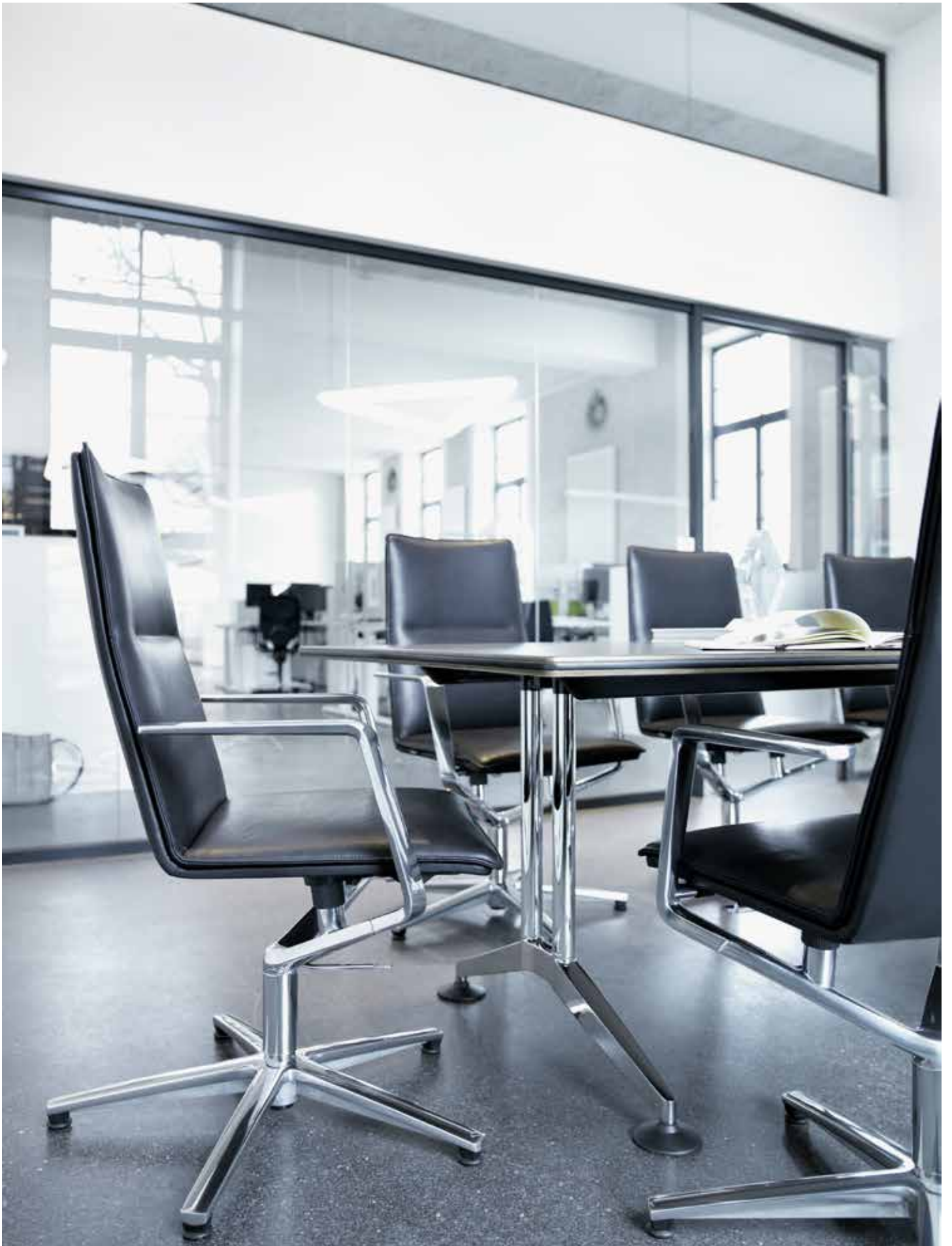
Conçu pour les environnements conférence les plus statutaires : le siège Sola en version cuir. Il est associé ici à une table de la gamme Logon.