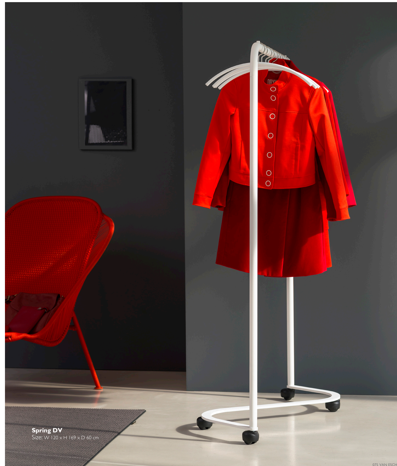
Spring DV Size: W 120 x H 169 x D 60 cm

Le système Spring DV, conçu par le bureau danois Pelikan & Co, peut facilement être déplacé. Grâce à leur forme particulière, les divers éléments s'emboîtent facilement et demandent donc peu d'espace de rangement.