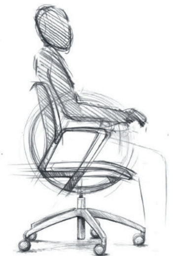
Teekeningen Illustrations: Paolo Fancelli