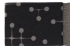
Eames Wool Blanket noir