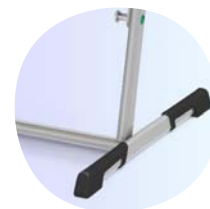
Schützt Boden und Stuhl: ASS-Bodenschoner