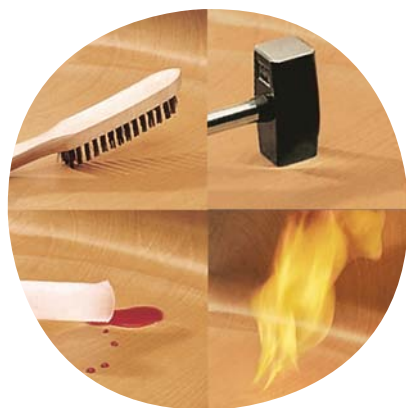
Unverwüstliche WOODPLAC-Schale, kratz-, bruch-, stoßfest & schwer entflammbar