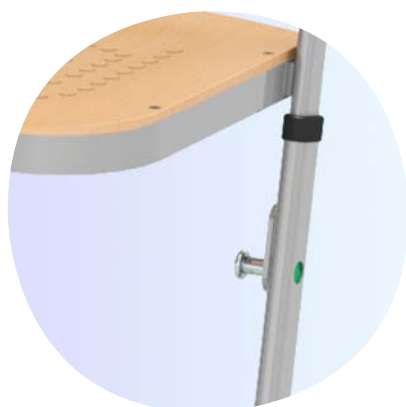
Mehrfach höhenverstellbar durch Sicherheitsverstellung