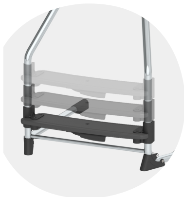
Werkzeuglose Verstellung mit nur einer Hand