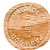
Pagholzmöbel aus nachhaltiger Forstwirtschaft