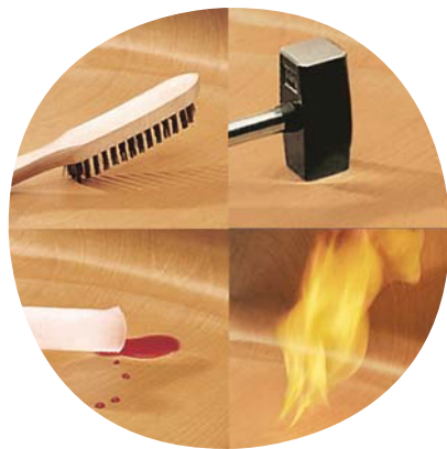
Unverwüstliche PAGHOLZ®-Schale, kratz-, bruch- und stoßfest