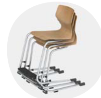
Bis zu 3 Stühle stapelbar